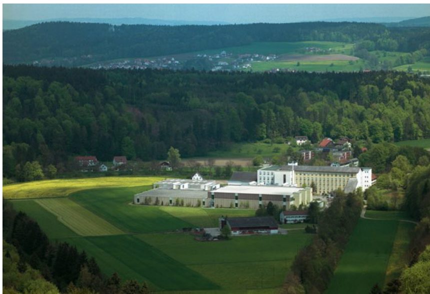
Hermann Bühler AG, Sennhof, Schweiz